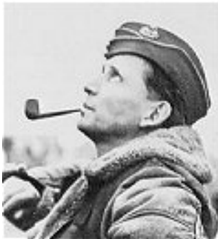
2.sz. kép. A. W. Tedder

AZ ÖNÁLLÓ LÉGIERŐ elmélete szerint a légierőnek önálló haderőnemként kell funkcionálnia és fő feladata a légi fölény (légi uralom) kivívása (megtartása), valamint, Douhet-elveinek megfelelően, stratégiai légitámadások végrehajtása az ellenség hadipotenciálja, de legfőképpen a lakossága ellen. Az első önálló légierővel Nagy-Britannia rendelkezett, majd a második világháború után egyre több nemzet tette magáévá ezt a légierő-szervezési koncepciót.