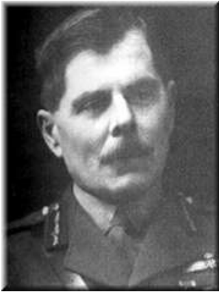
2. sz. kép Lord Trenchard

A régebbi – 1960 előtti – légierő-elméletekről összességében kijelenthető, hogy döntően a clausewitz-i és jomini-féle háború felfogás mentén foglalják rendszerbe a légierő lehetséges alkalmazását a háború politikai céljainak a megvalósítása érdekében. Alapvetően a megsemmisítésre kiválasztott objektumok szempontjából, három „ célcsoport ” szerint választhatjuk szét őket.