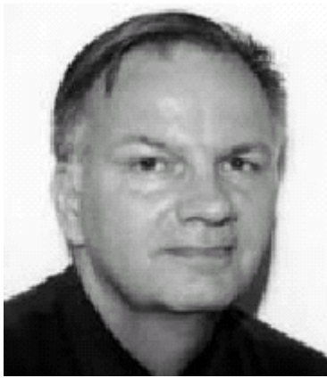
8. sz. kép Philippe Meilinger

Az elmélet egyes részeit megkérdőjelezők közül a legjelentősebb elismertséget PHILLIP S. MEILINGER 28 vívta ki magának. Kritikai munkássága kiinduló alapjának tekintette, hogy