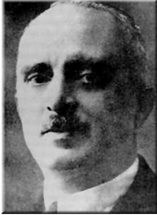
1. sz. kép Giulio Douhet

A koncepcióalkotásban az első jelentős eredmény az olasz GIULIO DOUHET 3 tábornok nevéhez köthető, aki „ A légi uralom ”-című könyvében megalkotta a korlátlan légi háború teóriáját, egy önálló légi hadsereg (légierő) vízióját, amelynek fő feladata a légi uralom