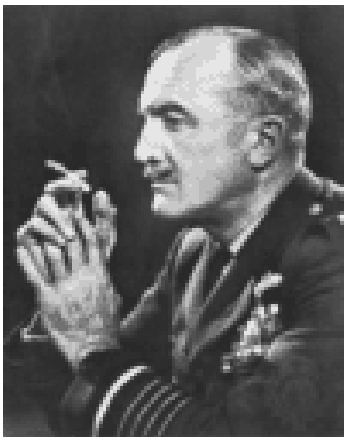
5. sz. kép J. C. Slessor

A SIR JOHN COTESWORTH SLESSOR 19 teóriája alapján végrehajtott légitámadásokban az ellenséges csapatokat, haditechnikai eszközöket, raktárakat és ellátó bázisokat pusztítják. Slessor úgy gondolta, hogy a katonai siker elérése az ellenséges állammal szemben elegendő a politikai célok eléréséhez.