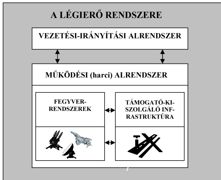
3.sz. ábra A légierő, mint rendszer

Természetesen ez a megközelítés azonos légi hadviselési filozófiához is vezet. E szemléletmódnak köszönhetően a közös légi műveletekben egyértelművé válnak a különböző haderőnemekhez szervezett csapatok együttes alkalmazásával kapcsolatos kérdések. A nyugati katonai gondolkodásmódban elterjedt a problémák, feladatok rendszerszemléletű megközelítéssel való elemzése, így a légierő ilyen jellegű vizsgálatával is gyakran találkozhatunk. 32 A téma rendkívül széleskörű, én a pályázatomban csak a légierő rendszerként történő értelmezésének a legjellemzőbb, és véleményem szerint a leglényegesebb részeit foglaltam röviden össze.