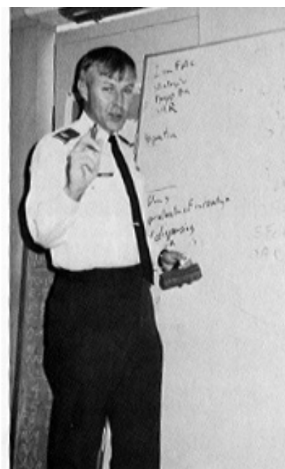
7. sz. kép John Warden

JOHN BOYD 21 a megsemmisítendő célokat a szűken értelmezett katonai vezetési és irányítási rendszerben képzelel el, teóriája szerint a harctéri sikerek az ellenséget a háborús stratégiájának a felülvizsgálatára kényszerítheti és elérhető a politikai célkitűzés, a területek átengedése (elfoglalása) és a nem kívánt politika megváltoztatása. Boyd a légitámadások időbeli lefolytatására a „+tempo” jelzöt használta, amely alatt nem egyszerűen a folyamatosan fokozódó intenzitású légi tevékenységet és nyomásgyakorlást értette, hanem elgondolása szerint a támadások intenzitásának a mindenkori „mentális, hadműveleti bénítás” és a felszíni erők követelményeinek kell megfelelnie. Így Boyd főkövetelménynek tekinti egy olyan a vezetési-irányítási rendszer létét, amely képes biztosítani a rendkívül gyors átmenetet a minimális harci légi tevékenységből a maximális igénybevételig.