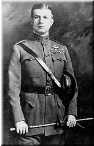
3. sz. kép W. Mitchell

MITCHELL 11 elgondolása alapján az ellenséges nemzet lakossága szempontjából létfontosságú központok (nagy városok, ellátócentrumok, közlekedési csomópontok, stb.) ellen végrehajtott bombázásokkal elérhető, hogy az adott országban polgári elégedetlenség, vagy felkelés „ elsöpörje ” a kormányon levőket és így a célzott politikai események bekövetkezzenek.